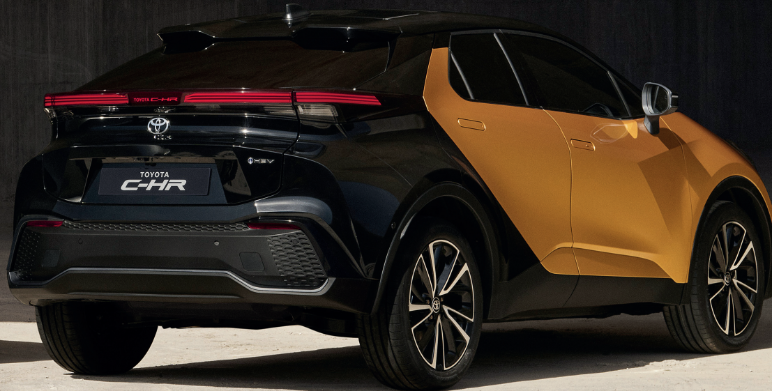
Toyota C-HR Hybride